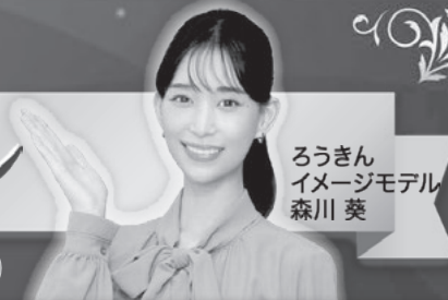
ろうきん イメージモデル 森川 葵